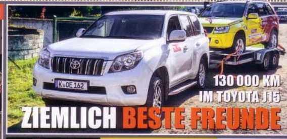
130 000 KM IM TOYOTA J15