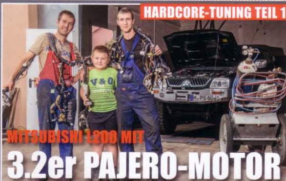
MITSUBISHI 2000 MIT