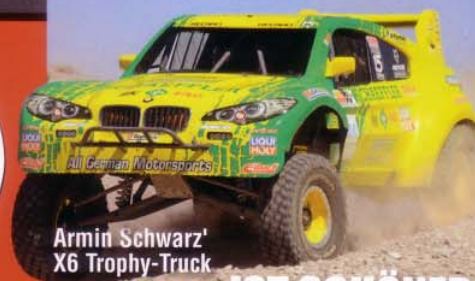
Armin Schwarz' X6 Trophy-Truck

Das 4x4-Magazin für die Freiheit auf Rädern